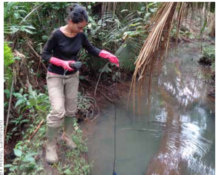
Photo : Diagnostic de la présence de produits phytosanitaires (BV Méfou, Cameroun)