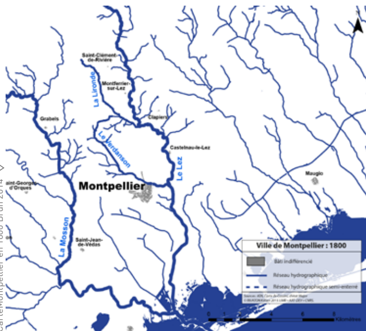
Carte Montpellier en 1800 Brun 2014

> Les programmes portés par l'unité relèvent tant du challenge eau et agriculture que du challenge ressource en eau et scénarios prospectifs .