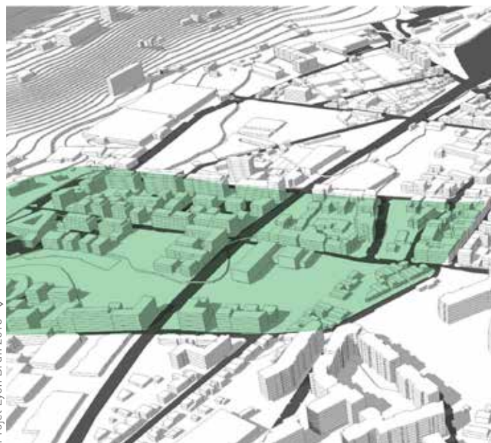
Projet Lyon Brun 2015

Programme transversal Asymétries, action publique et jeux d'échelle